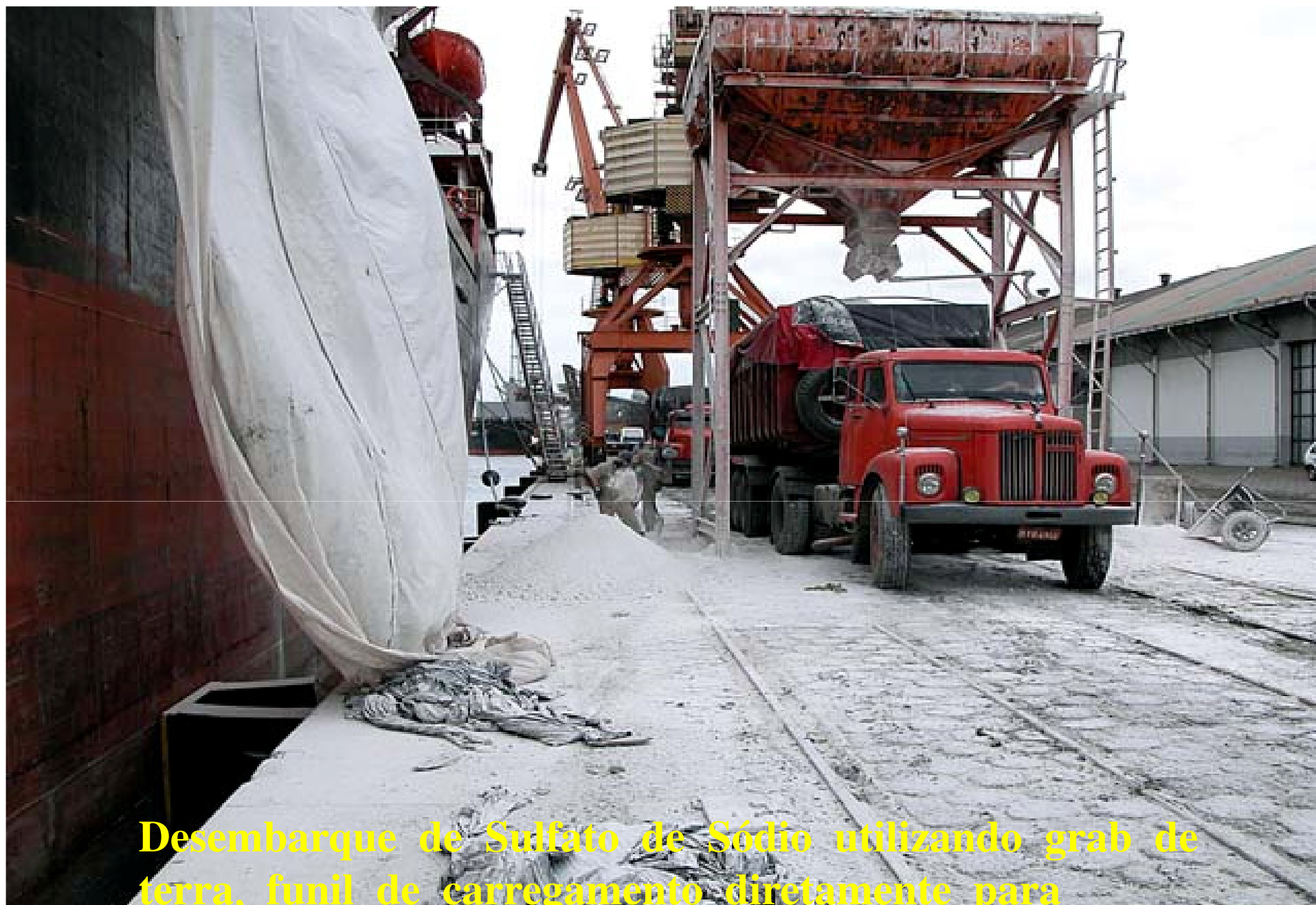
Desembarque de Sulfato de Sódio utilizando grab de terra, funil de carregamento diretamente para caminhões