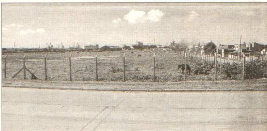
Casas térreas e assobradadas serão construídas em terreno no bairro Santa Tereza

O projeto para a construção do Residencial Getúlio Vargas 2 também precisa ser entregue ao governo federal no próximo dia 15. Este estará localizado no quarteirão formado pelas ruas Almirante Anphilóquio Reis, João Pessoa, Bento Martins e Dom Pedro II, antiga área do Irga, adquirida pelo Estado por R$ 457