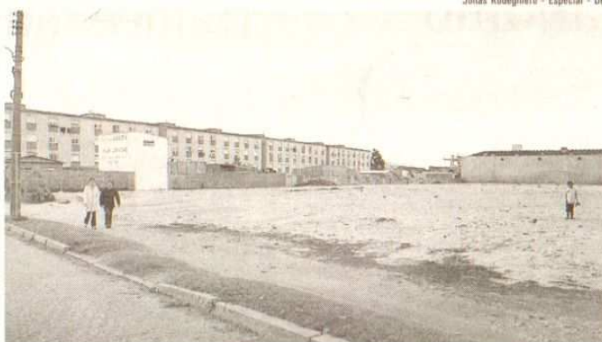
Terreno onde haverá construção foi limpo e aterrado pela prefeitura

A empresa que venceu a licitação é a Técnica Paranaense de Engenharia e Construções (Tekpar). As obras receberão recursos do Programa de Aceleração do Crescimento (PAC) com a contrapartida do município. No total para a habitação, incluindo outros condomínios que ainda estão no papel, os investimentos são R$ 22 milhões do Governo Federal e R$ 4 milhões da prefeitura.